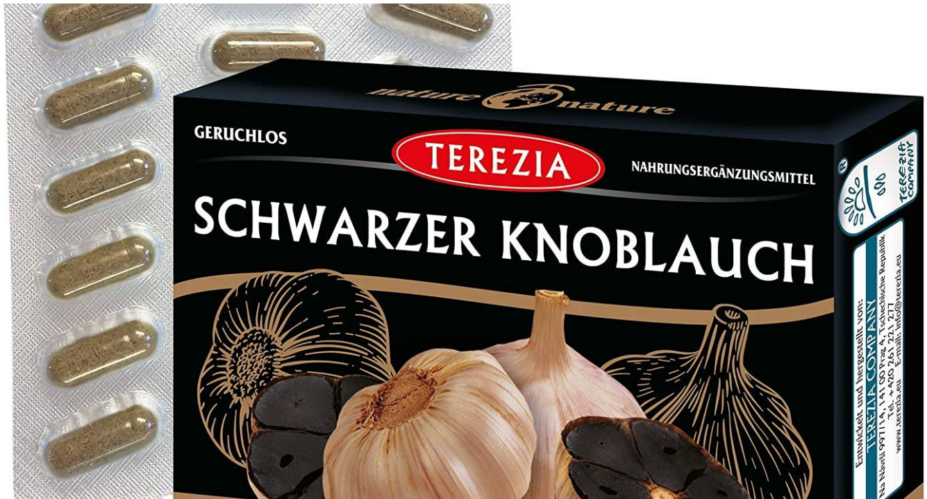
( https://www.black-garlic.ch/schwarzer-knoblauch-kapseln/ )