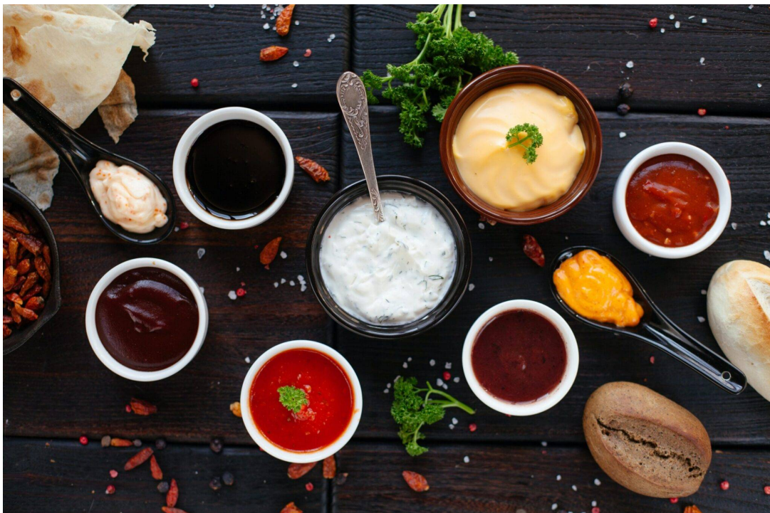
( https://www.black-garlic.ch/knoblauch-dip/ )

mehr » ( https://www.black-garlic.ch/schwarzer-knoblauch-kapseln/ )